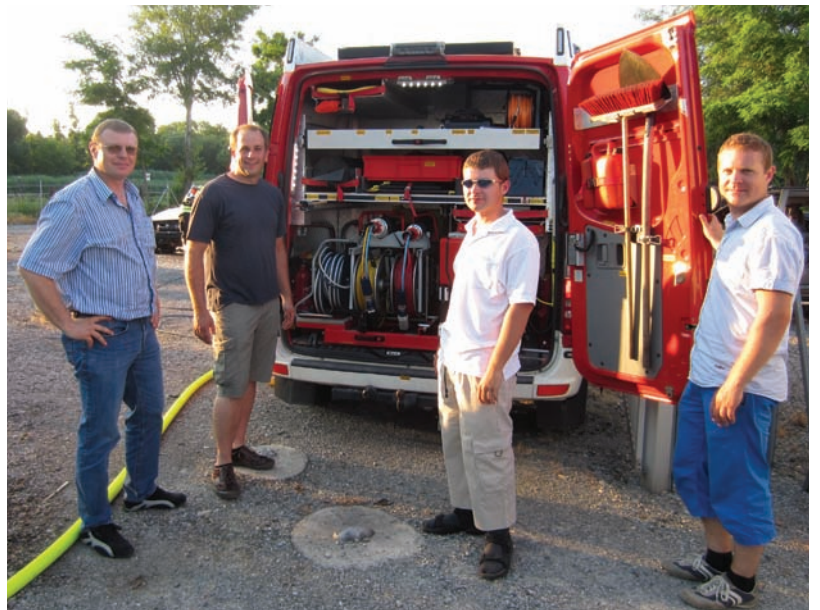
Die Kameraden der FF Moosbrunn bei der Besichtigung eines vergleichbaren Fahrzeuges der FF Ebreichsdorf

soll nun die beste Variante für die Feuerwehr und für Moosbrunn herausgearbeitet werden.