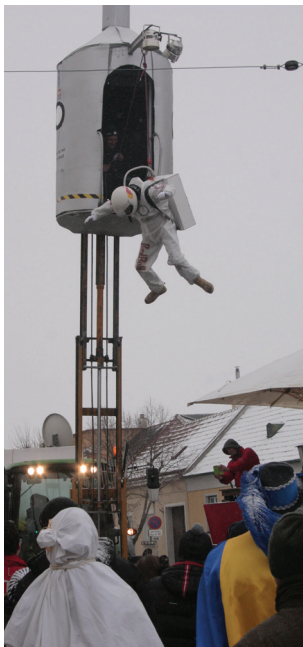
Felix Baumgartner beim Sprung und die Faschingspuppe