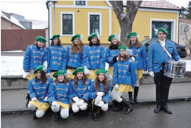
Nach vielen Jahren gab es erfreulicherweise wieder eine Mädchengarde

Moos-Moos: Zum 25. Jubiläum des Moosbrunner Faschingsumzuges scheuten die zahlreichen teilnehmenden Gruppen keinen Aufwand und präsentierten erstaunliche Wägen und Fussformationen. Trotz frostiger Witterung ging das lustige Treiben am Hauptplatz bis die Abendstunden.