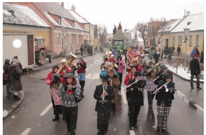
Der Musikverein Moosbrunn beim Einmarsch auf den Hauptplatz, wo aufgespielt wurde