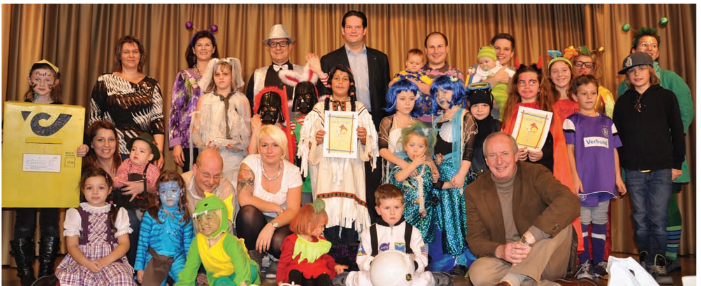
Die Sieger der Maskenprämierung beim ÖVP-Kindermaskenball