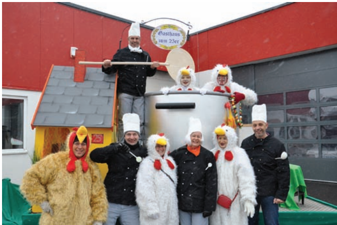
Der Gewerbeverein als Köche und Hühner

Nach Einbruch der Dunkelheit wurde als krönender Abschluß ein Feuerwerk gezündet, welches von den Firmen Huber Kfz-Technik und Golfclub Frühling sowie der Firma Jost Feuerwerke gespendet wurde.