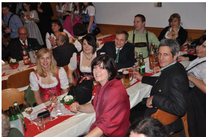
Ausverkaufter Festsaal beim Landjugendball, im Bild eine Abordnung aus Velm