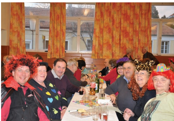
Die Faschingsjause des ÖVP-Seniorenbundes im Pfarrsaal war wieder gut besucht