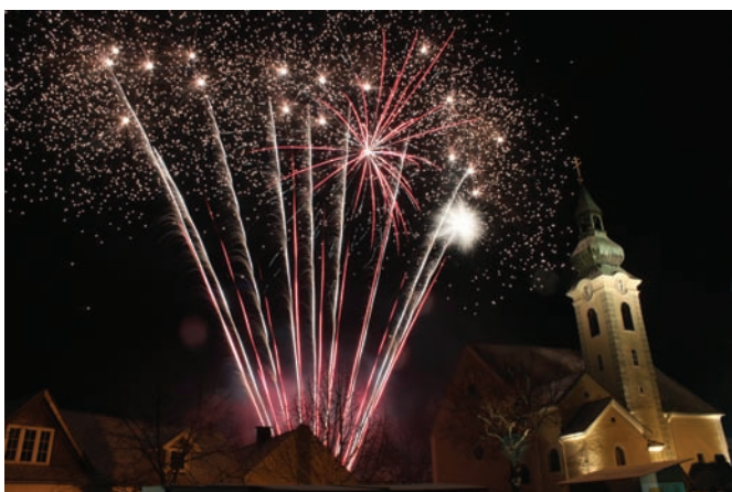
Das eindrucksvolle Abschlußfeuerwerk