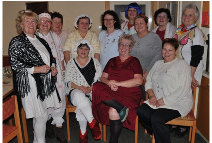
Die Pyjamaparty der ÖVP-Frauen im Pfarrstüberl