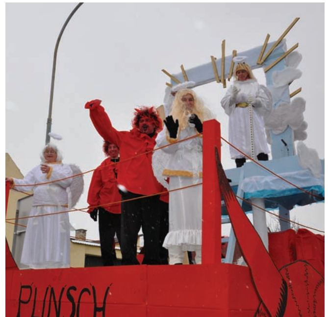
Engelchen und Teufelchen