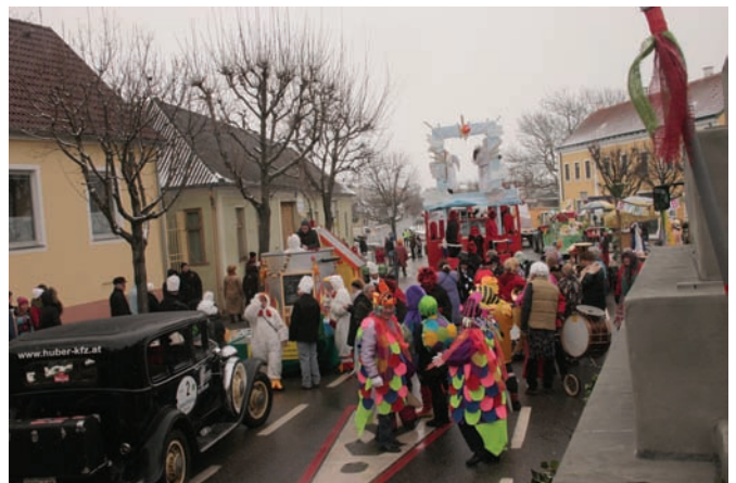
Der Hauptplatz füllt sich mit den eintreffenden Wägen und Gruppen