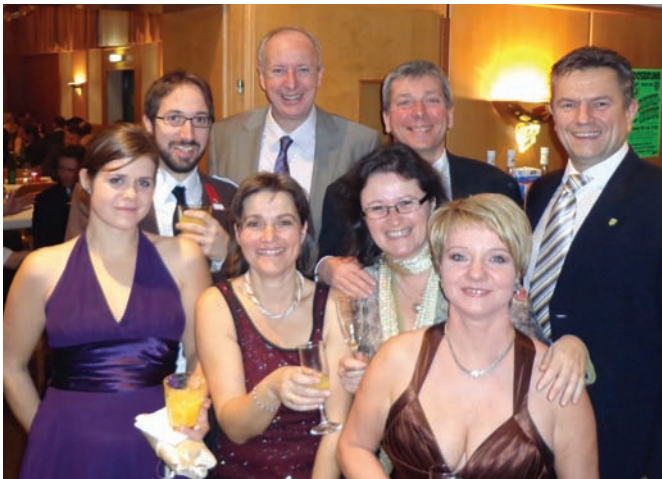
Gute Laune beim Feuerwehrball der FF Moosbrunn