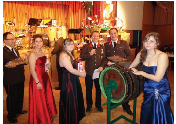
Verlosung der Tombolapreise beim Feuerwehrball