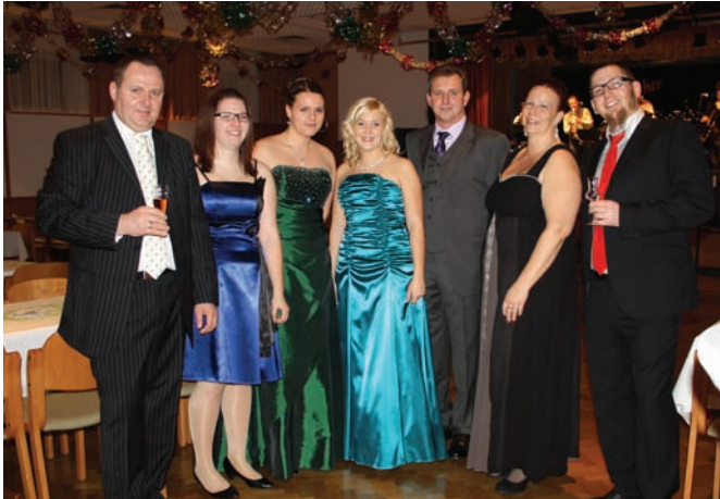
Musikerball des Musikvereins Moosbrunn

Die heurige Ballsaison war durch den kurzen Fasching für fleißige Ballgeher sehr intensiv. Durch die große Bandbreite der Veranstaltungen von Elegant bis Ungezwungen war für alle Tanzbegeisterten etwas Passendes dabei.