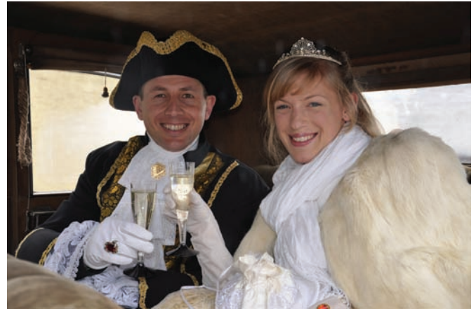
Prinzessin Karolin I. und Prinz Jopper I. beim genussvollen Sekstrinken im Oldtimer-Prinzenwagen