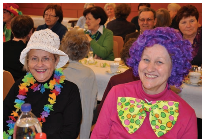
Gut gelaunte und maskierte Seniorinnen und Senioren genossen den Nachmittag bei Kaffee und Krapfen