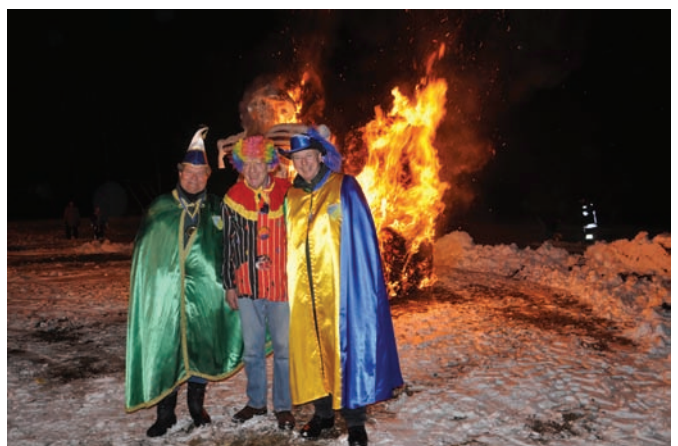
Zum Ende das Verbrennen der Faschingspuppe