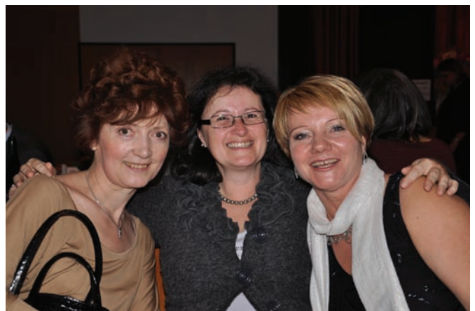
Gute Laune war bei der Schlagerparade der SPÖ Moosbrunn Programm