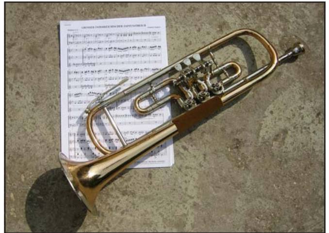
Trompetensoli prägen das imposante militärische Musikwerk