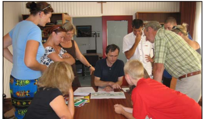
Da rauchen die Köpfe: Eltern und Spielplatzbüro bei der Arbeit

Nachdem im Juni Kinder der örtlichen Volksschule bei einer "Spielforscherwerkstatt" ihre Wünsche bekannt gegeben haben, erfolgte nun für den zukünftigen Spielplatz beim Eisteichweg vom Landschaftsarchitekten Dipl.Ing. Wagner ein Gestaltungsvorschlag. Am 19. Juli wurde der Entwurf der Interessentengruppe präsentiert. Aufgrund der gemeinsam erarbeiteten Vorschläge erfolgte die Ausschreibung an die Spielgerätefirmen, um die Förderkriterien der NÖ Landesregierung zu erfüllen. Noch heuer sollen die Erdarbeiten für die erforderlichen Geländemodellierungen und auch Pflanzungen unter Mitwirkung der Volksschule erfolgen. Der Ankauf und die Aufstellung der Spielgeräte ist im Frühjahr nächsten Jahres vorgesehen.