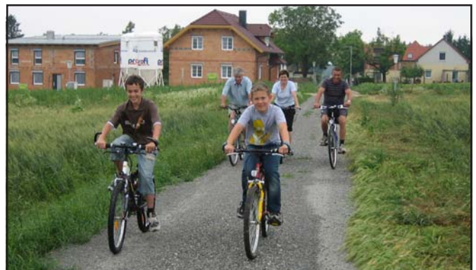
Hier radelt man naturverbunden in den Nachbarort