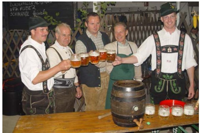
"Anzapft is" heißt es auch diesmal wieder in Moosbrunn