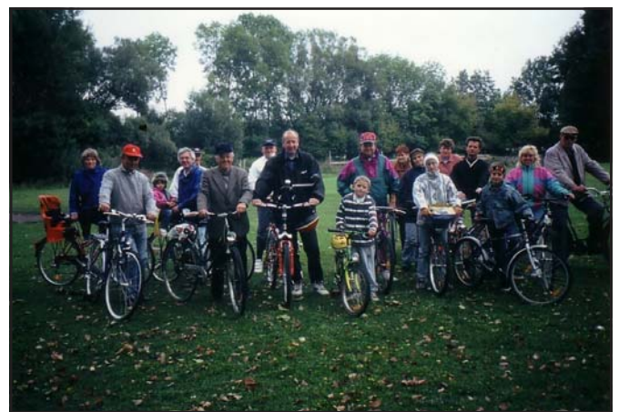
Fahren auch Sie mit uns nach Deutsch-Brodersdorf