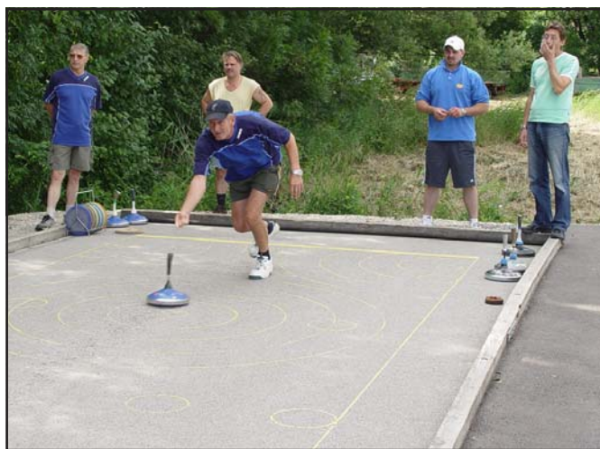
Gekonnt wird der Stock auf die Asphaltbahn gesetzt

Der HSSC Moosbrunn feiert sein 5-jähriges Bestehen mit seinem „5. Herbstturnier“ am 14. September 2007 ab 17 Uhr auf der Asphaltstockbahn beim Skaterplatz. Die Stockschützen freuen sich auch auf Ihren Besuch!