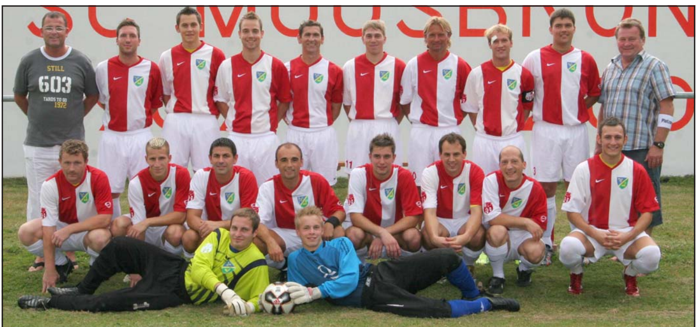
Rassige Spielszenen, die Obmänner der teilnehmenden Vereine, Pokalübergabe, die Kampfmannschaft des SC Moosbrunn