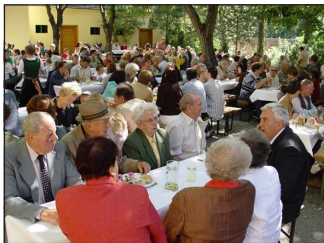
Gemütliche Stunden gibt's wieder einmal im Pfarrgarten

Für 9. September lädt die Pfarre Moosbrunn zum Pfarrheurigen ein, Beginn ist um 10'30 Uhr im Pfarrgarten. Es gibt Schnitzel, Kümmelbraten, Blunzen, Presswurst, Mehlspeisen - die „Bradlfett'n“ spielt dazu auf.