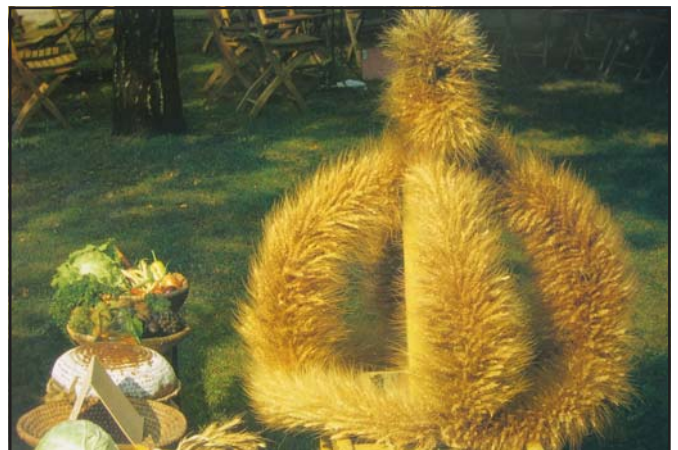
Die aus Feldfrüchten gebildete Erntekrone im Pfarrgarten