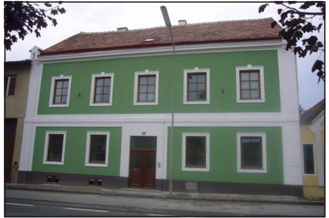
Zweifellos eine Bereicherung für das Moosbrunner Ortsbild

Gänzlich ungewohnt für den Passanten besticht die Fassade der „Alten Schule“ in der Hauptstraße 61 in kräftig-frischem Grün, die Fensterumrahmungen und diverse Fassadengliederungen sind in Weiss gehalten. In der Vorwoche wurden von der Baufirma Wieser die Baumeister- und Malerarbeiten endgültig fertiggestellt. Zuvor schon musste man im Erdgeschoß des nicht unterkellerten Teiles das durchfeuchtete Mauerwerk trocknenlegen und die Feuchtigkeitsschäden in einer Wohnung sanieren. Im Zuge der Arbeiten wurden in geringem Maß auch Spengler- und Dachdeckerarbeiten durchgeführt. Demnächst sollen noch Fenster und Türen gestrichen werden, sodass sich dann Bewohner und Passanten über ein nicht alltägliches „Schmuckkasterl“ freuen können.